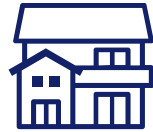
クリニック (無床診療所)